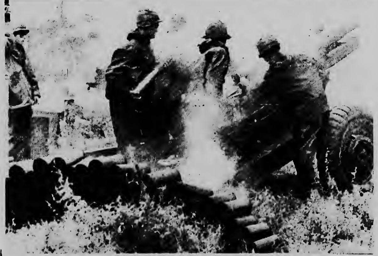
HY VAN, VIETNAM DEL SUR--Artilleria di e promer division di caballeria ta tirando nan Hiwitzer di 105 mm. contra trupanen guerrillero di Viet Cong. Nan ta calcula cu mas o menos 475 guerrillero comunista a ser mata, durante e operacion.

torial di China ora cu el a regresa di un mision riba Vietnam del Norte. E piloto a ser destaca, sano y salvo. Mientras tanto e promedivision di caballeria aereatransportada di ehército di Estados Unidos a continua enfrasca den un operacion 480 kilometer na noord di Saigon, huntu cu forzanan Sudvietnemesa. Cu a hanja informacion di contactonan importante cu enemigu durante dia di awe, sin embargo den e operacion aqul, forzanan aliado a mata 626 guerrilla comunista di Vietcong, manera a ser informa. Mas laat nan a informa cu otro aparato di forza aerea un F-105 a perde den sudeste di Vinh, Vietnam del Norte y cu e piloto a aparece riba lista di esnan desapareci. E hecho aqul a ser registra durante e bombardeonnan di ayera na suelo Vietnemesa. E numero di avionnan perdi di parti di Estados Unidos a subi ayera na tres.